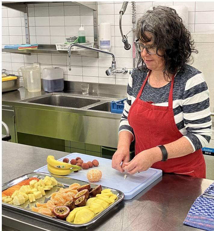
Helferin am Vorbereiten des Vitamin-Buffets